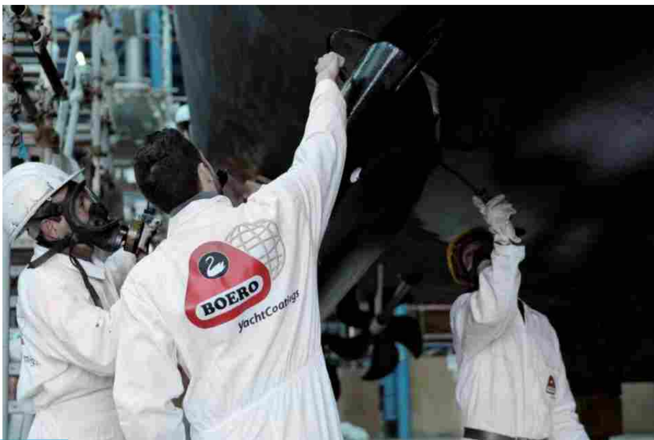
Gruppo Boero partecipa al 61° Salone Nautico di Genova 2021

Gruppo Boero attraverso la partecipazione dei suoi brand del mondo yachting al più grande evento del Mediterraneo dedicato alla nautica dimostra, ancora una volta, l'eccellenza Made in Italy e la capacità di guardare al futuro con tecnologie sempre più innovative e continui investimenti in ricerca e sviluppo.