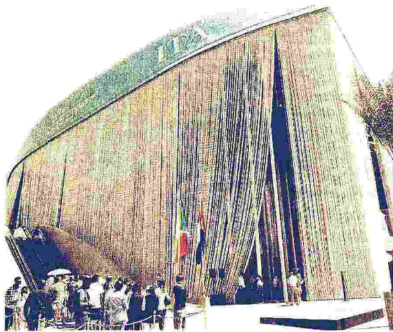
Expo Dubai 2020. Visitatori all'ingresso del Padiglione Italia