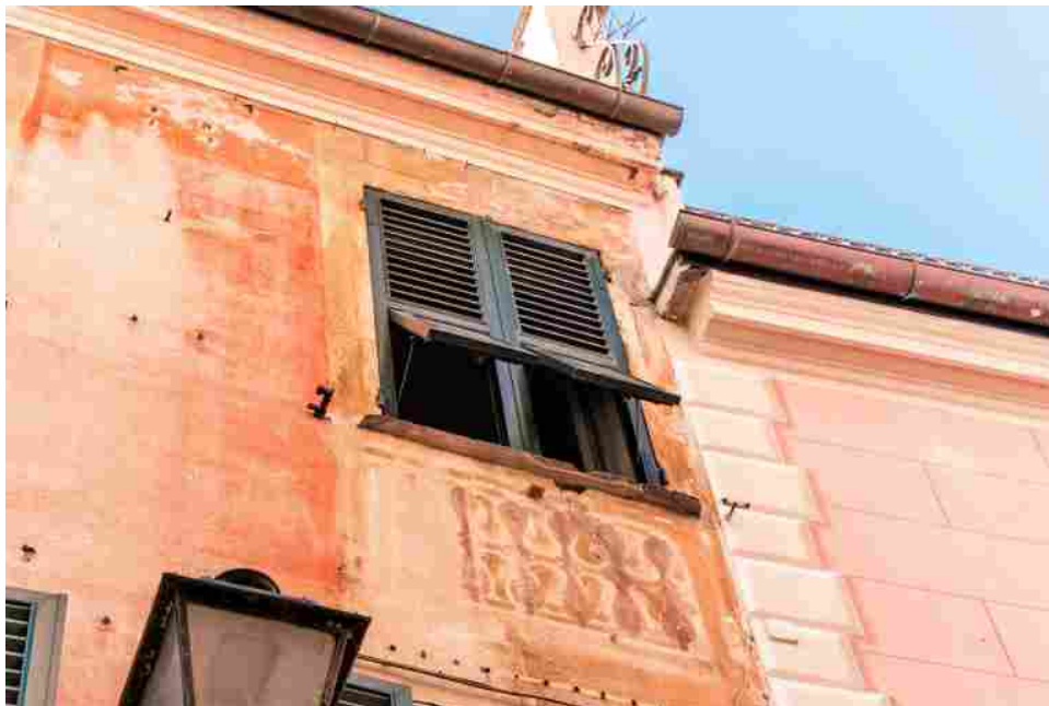
Progetto Colore per Rapallo di Boero