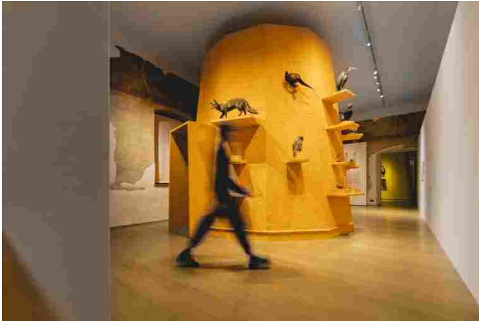
Dentro il colore, MUSE.

L'accurata selezione delle tonalità e la pitturazione dei vulcani ha visto la preziosa collaborazione e il contributo del Gruppo Boero , azienda che da oltre 190 anni un riferimento in tema di colore nel mondo dell'architettura e della nautica.