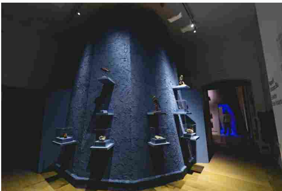
Dentro il colore, MUSE. Ph. Michele Purin

La messa in scena espositiva dalla materia conduce alla luce . Il simbolico cratere di ciascun vulcano incanta con visioni di immagini sonore . Sospesi, circolari, ipnotici, nella dissolvenza di forme e corpi materici, i video artistici svelano atmosfere tra sogno e realtà, inconscio e coscienza. In una relazione magica della luce e dell'oscurità, epifania e preludio della vita.