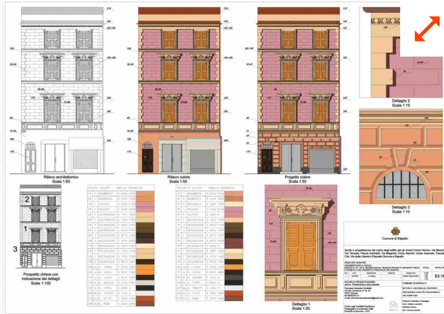
4 Progetto Colore per Rapallo di Boero