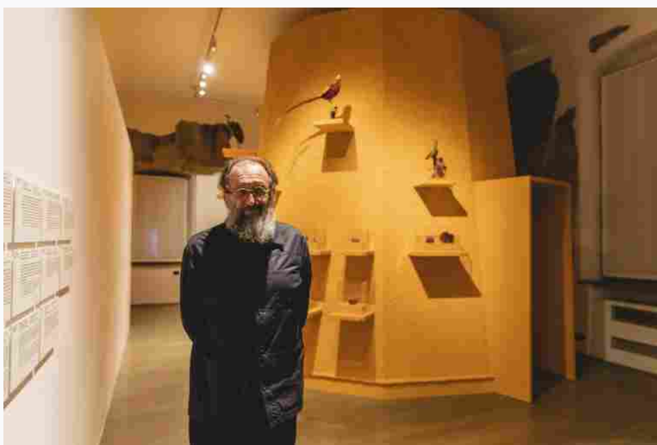
Michele De Lucchi, MUSE, Dentro il Colore.

Lo stesso De Lucchi illustra il concetto attorno al quale si sviluppa la mostra. “Il colore di per sé non esiste”, spiega il progettista. “È luce, energia e vibrazione di particelle . Siamo però abituati ad attribuirlo alla materia. Tutta la mostra gira attorno a questa relazione tra materia e luce , tra tangibile e intangibile, tra realtà e immaginazione”.