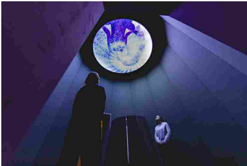
Dentro il colore, MUSE.