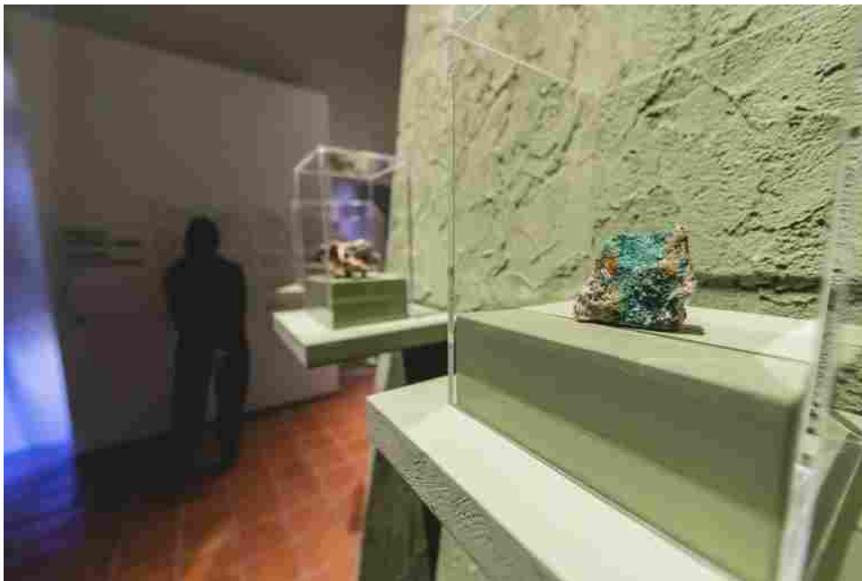
Dentro il colore, MUSE. Ph. Michele Purin