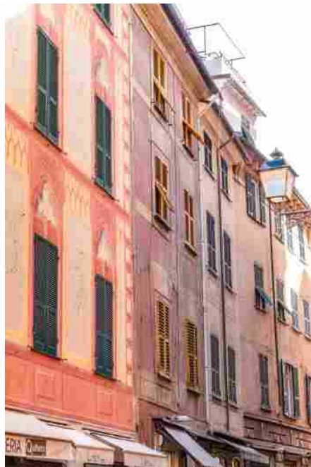
Progetto Colore per Rapallo di Boero