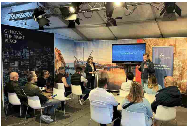
Boero YachtCoatings protagonista a Genova del Grand Finale di The Ocean Race

Ritaglio stampa ad uso esclusivo del destinatario, non riproducibile.