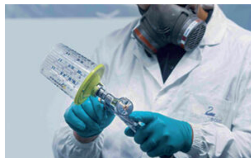
Nella foto: Un tecnico al lavoro.

SAN DONATO MILANESE – Versalis , la società chimica di Eni, e Gruppo Boero , società leader nel settore dei prodotti vernicianti per edilizia e yachting che da alcuni anni ha iniziato un percorso specifico di Responsabilità Sociale, hanno avviato una collaborazione per lo sviluppo di prodotti destinati al mercato della nautica realizzati con materie prime rinnovabili.